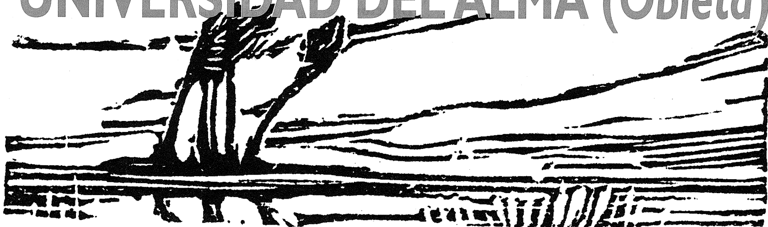
Xilografía de R.Y. Creston